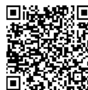
申込みフォーム QR コード

【寄附金申込書送付先及びお問合せ先】 第 61 回日本生体医工学会大会 運営事務局 〒939-8063 富山市小杉 120 (株式会社 P C O 内) TEL : 076-461-7028 E-mail : jsmbe@pcojapan.jp 担当 : 上田、大城